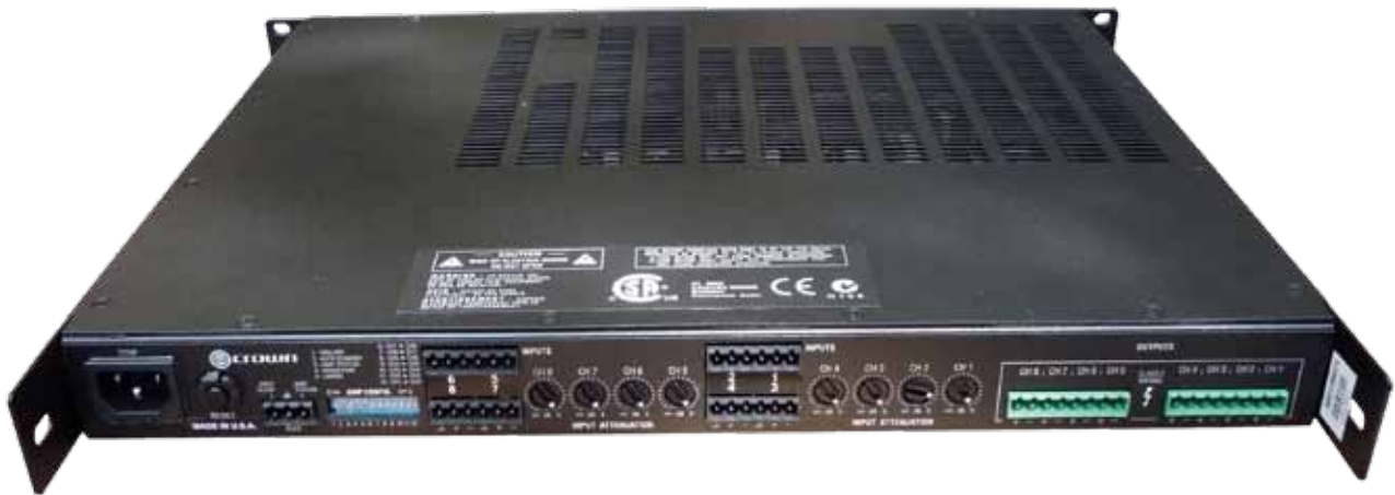
Widok wzmacniacza od strony panelu tylnego, na którym umieszczono wszystkie regulatory i przyłącza.

nieznacznie, dochodząc do około 100 W. Warto zauważyć, że przebieg sinus na ekranie oscyloskopu jest idealny, nie widać żadnych aberracji, dość często występujących w tanich, popularnych wzmacniaczach cyfrowych czy choćby tylko wyposażonych w układy zasilaczy impulsowych i klasyczną końcówkę analogową. Jeśli chodzi o układ limitera, to po jego uaktywnieniu przez załączenie mikrowyłącznika w pozycję ON, nie ma już możliwości przesterowania wzmacniacza. Układ działa bardzo skutecznie, a dioda limit pokazuje dokładnie moment, w którym ogranicznik zaczyna pracować. Szczerze mówiąc, trochę dziwi mnie zastosowanie opcji jego odłączenia, gdyż moim zdaniem nic nie stałoby na przeszkodzie, aby limiter był załączony na stałe. Co innego filtr górnoprzepustowy, którego załączenie powoduje, że sygnał poniżej 70 Hz jest mocno tłumiony. Tutaj rzeczywiście warto mieć kontrolę nad pasmem, bo np. przy wykorzystaniu końcówki do celów wzmacniania sygnałów mowy (komunikaty) warto ograniczyć pasmo od dołu, ale