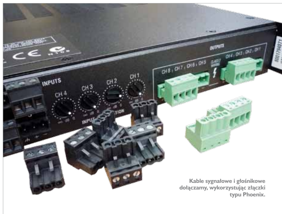
Kable sygnałowe i głośnikowe dołączamy, wykorzystując złączki typu Phoenix.

Tak z grubszą wyglądającą dostępną dla użytkownika funkcje końcówki, szczegółowe dane dostępne są