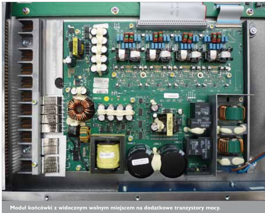
Moduł końcówki z widocznym wolnym miejscem na dodatkowe tranzystory mocy.

co to naprawi i telewizor, i wzmacniacz, i żelazko, odeszły już chyba bezpowrotnie do przeszłości.