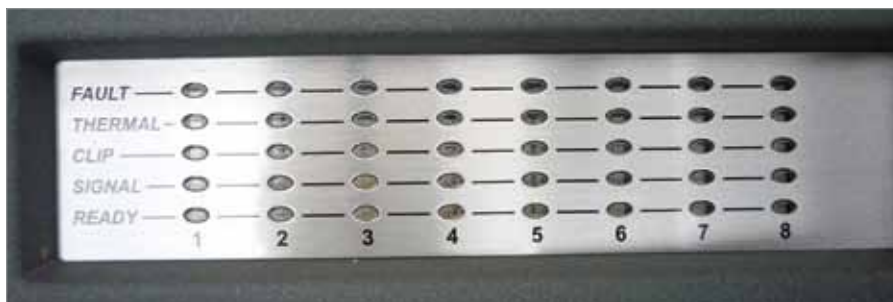
Panel diod kontrolnych sygnalizujących stan pracy wzmacniacza.