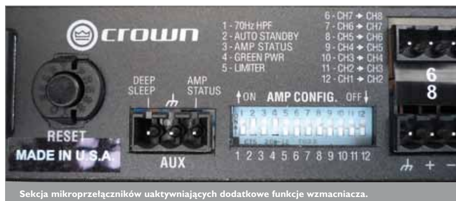
Sekcja mikroprzełączników uaktywniających dodatkowe funkcje wzmacniacza.

W radiowęzłach co prawda istnieje teoretyczna i praktyczna możliwość zastosowania większej ilości głośników, ale stworzenie kilku zupełnie niezależnych torów stanowi już spory problem, który bez trudu daje się rozwiązać właśnie dzięki zastosowaniu końcówek wielokanałowych. Firmie Crown udało się zmieścić w module o wysokości 1 U i wadze zaledwie 4,5 kg aż osiem niezależnych wzmacniaczy z indywidualnymi wejściami, regulatorami wzmocnienia, a także z niezależnymi kontrolkami stanu pracy i kilkoma dodatkowymi funkcjami komutacji, filtrowania i ograniczania sygnału.