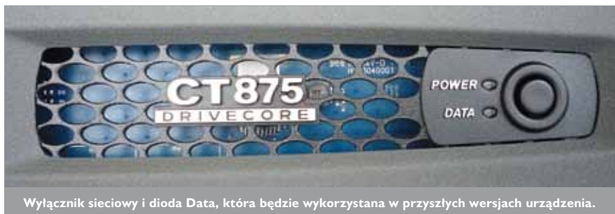
Włacznik sieciowy i dioda Data, która będzie wykorzystana w przyszłych wersjach urządzenia.