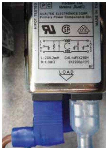
Wzmacniacz wyposażono w zintegrowany układ filtru przeciwzakłóceniewego RLC.

układy wejściowe i regulacyjne, czyli wszystkie te elementy, które funkcjonalnie związane są z panelem tylnym. Ujrzymy również idącą z niej wiązkę obsługującą układy diod kontrolnych zlokalizowanych na płycie czołowej. W górnym prawym rogu,