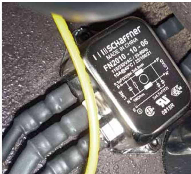
Ważną rolę w testowanych zestawach pełni filtr przeciwzakłóceńowy.