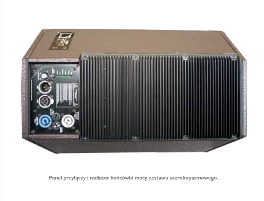
Panel przyłączy i radiator końcówki mocy zestawu szerokopasmowego.

W obu paczkach wykorzystano moduł końcówki mocy o oznaczeniu DIGIMOD 1000 wyprodukowany przez włoską firmę Powersoft. Jest to stereofooniczna końcówka używana przez wielu producentów,