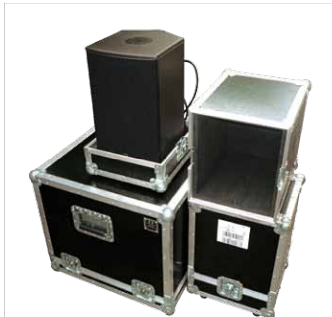
Zestawy do testu dystrybutor dostarczył w solidnych obudowach typu flight-case.

Moduły wejściowe w obu zestawach mają identyczne wymiary i umieszczone są na oddzielnej,