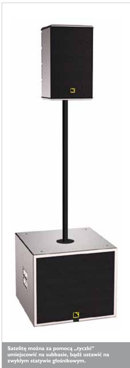
Satelitę można za pomocą „tyczki” umiejscowić na subbasie, bądź ustawić na zwykłym statywie głośnikowym.

Firmowa instrukcja obsługi również zamieszcza poglądowe, choć mocno uśrednione wykresy korekcyj z wykorzystaniem presetów, które tworzone są na drodze cyfrowej, we wbudowanym procesorze sygnałowym DSP. Warto również zauważyć, że paczka basowa ma charakterystykę przenoszenia bardziej zbliżoną do obudowy band-pass niż klasycznego bass-reflexu, jakim w istocie jest, wynika to z elektronicz-