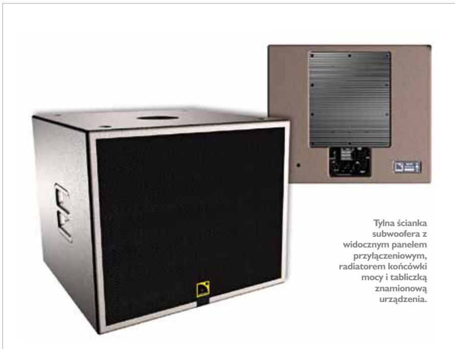
Tylna ścianka subwoofera z widocznym panelem przyłączeniowym, radiatorem końcówki mocy i tabliczką znamionową urządzenia.

Skoro kwestie pomiarowe zostały już omówione, przyszedł czas na kilka subiektywnych wrażeń odsłuchowych. Piszę subiektywnych, gdyż w przeciwieństwie do mierzalnych parametrów fizycznych ocena brzmienia zawsze będzie „przefiltrowana” przez gust i przyzwyczajenia testującego – i całe szczęście, bo w przeciwnym wypadku nie byłoby o czym dyskutować.