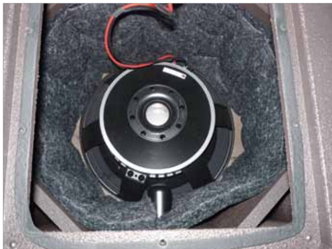
Obudowa subwoofera to konstrukcja typu bass-reflex, wykonana ze sklejki i wyposażona w głośnik 15" z potężnym ferrytowym obwodem magnetycznym.

posażono z kolei w rączki wyfrezowane w materiale obudowy oraz niskie nóżki, które by spełniły swoją rolę, trzeba zadbać, by subbas stał na równym podłożu. Natomiast satelita I08P nie posiada nóżek, widocznie docelowym miejscem pracy ma być statyw. Muszę jednak przyznać, że estetyka kolumn jest bez